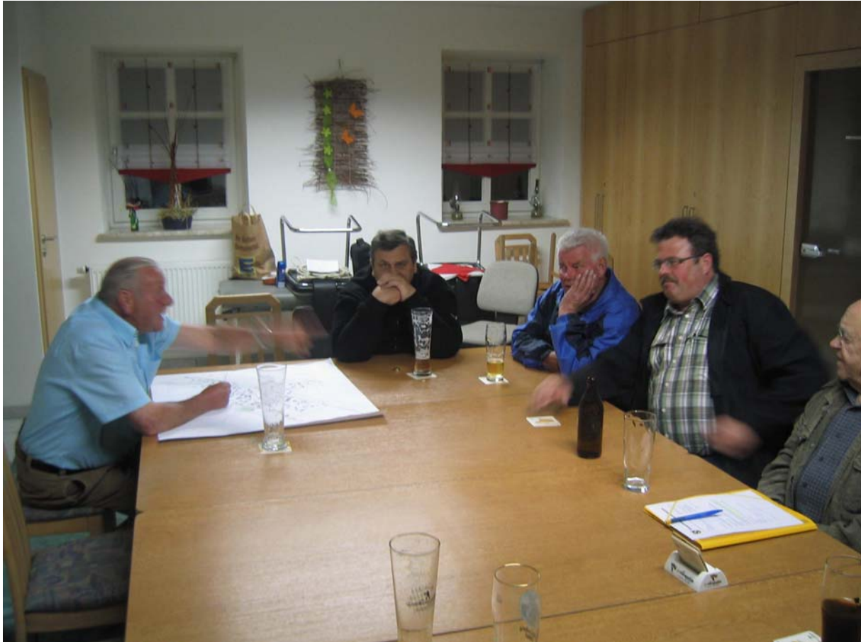
Geschrieben am 10. Mai 2011, Pomp Jürgen.